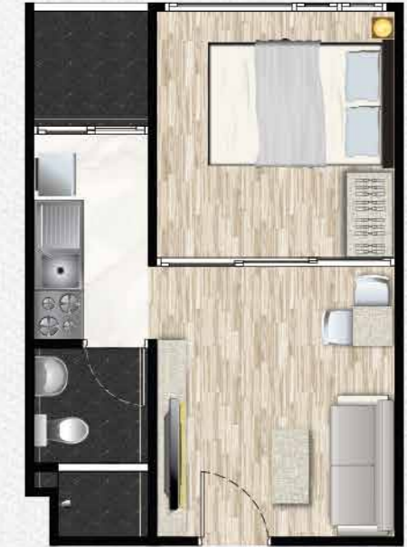
Type B 28 ตร.ม.