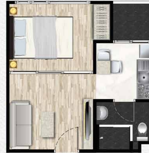
Type A 26.50 ตร.ม.