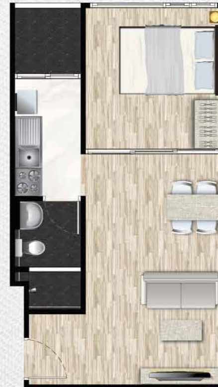
Type B-1 34 ตร.ม.