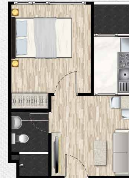
Type C 30 ตร.ม.